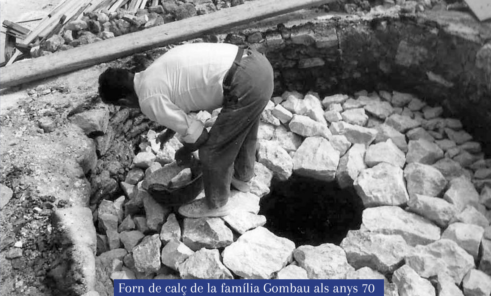
Forn de calç de la família Gombau als anys 70